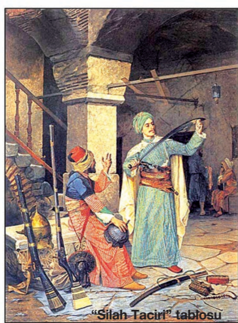
"Silah Taciri" tablosu

Resam olarak sağlığında üne kavuşan Osman Hamdi Bey, figürlü kompozisyonlar ve porteler üzerinde çalışarak Türk resminde ilk kez figür kullanan ressamdır. Resimlerinde mimari detaylar ve dekorasyon oldukça yoğun olarak yer alır. Tablolarda başkarakter olarak sık sık kendine de yer verir, çeşitli kıyafet ve pozlar ile çektiği fotoğraflarını çizimlerinde kullanır. Resimlerini günümüzde yerli ve yabancı