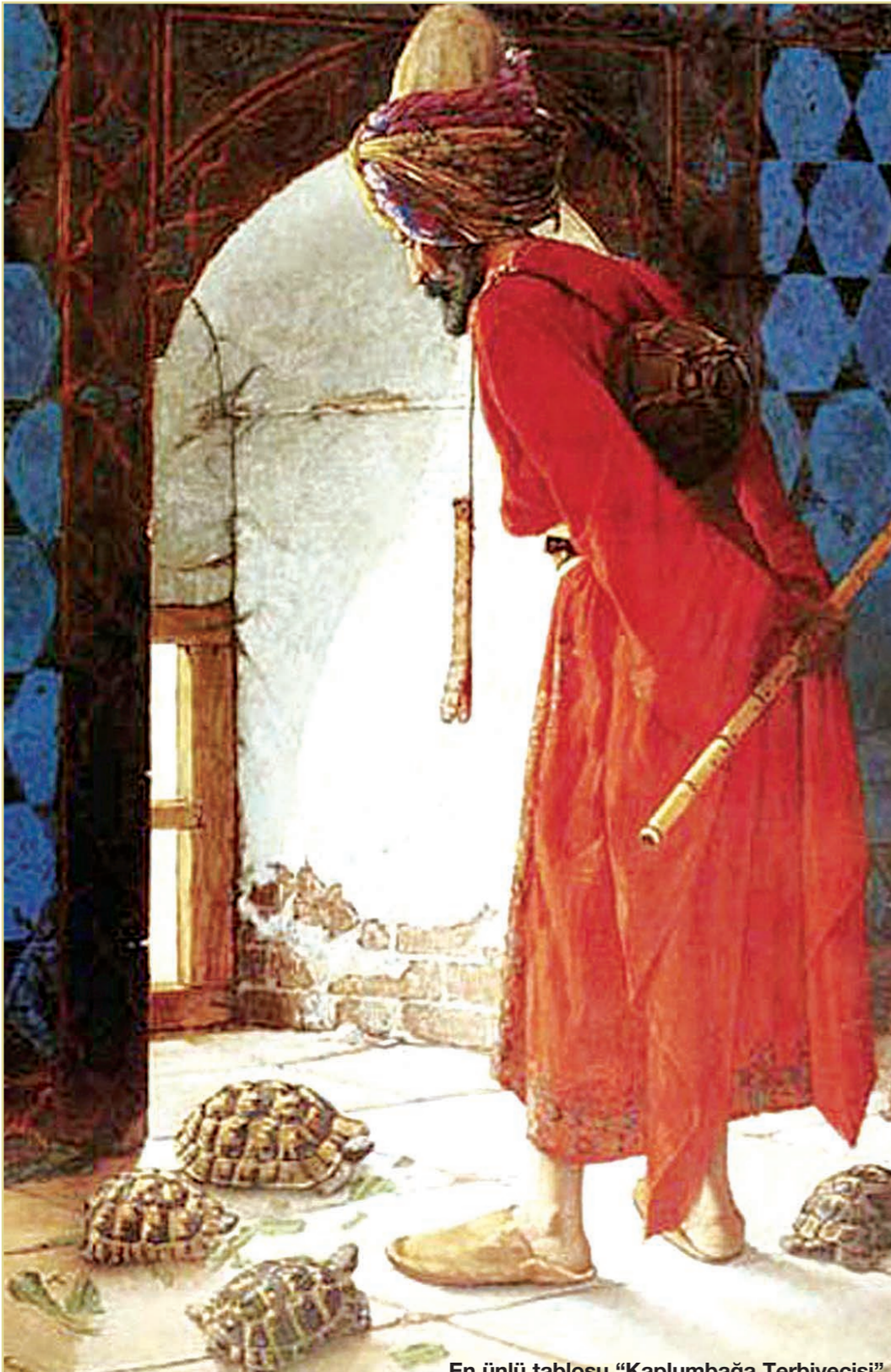
En ünlü tablosu "Kaplumbağa Terbiyecisi"