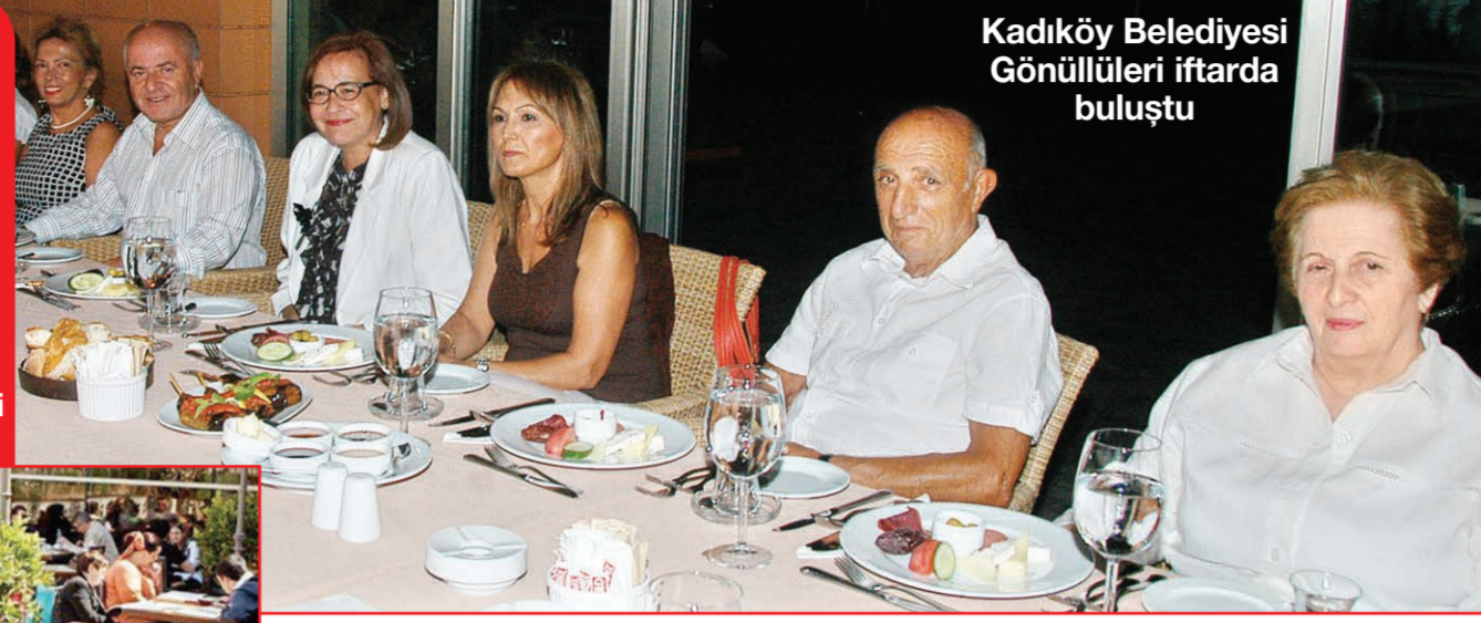
Kadıköy Belediyesi Gönüllüleri iftarda buluştu

Kadıköy'ün çiçeği burnunda alışveriş merkezi Kozy, Ramazan'da sema gösterilerinden fasıl dinletisine, geleneksel Türk sanatı atölyelerinden sağlık seminerlerine dek pek çok etkinliğe ev sahipliği yapıyor